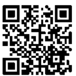
Video 6 / Benchmarking y empowerment en las instituciones educativas

A través de la comparación, la universidad recibe el conocimiento sobre la calidad de la educación en otras universidades e identifica las razones por las cuales estas obtienen mejores resultados, para así aprender de ellas y mejorar la calidad de una acción determinada (Cobo, 2009).