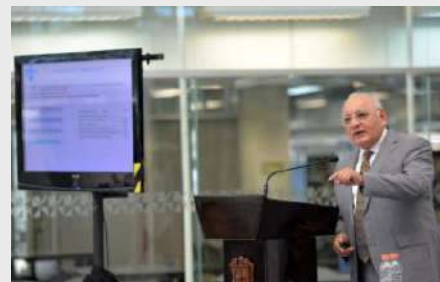
Imagen. Fuente. Periódico Universo. Consultado aquí .